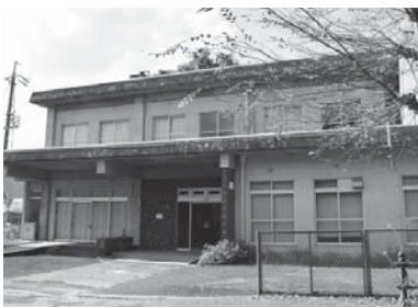
旧老人福祉センター

旧老人福祉センターは、老朽化が著しいことに加えて、現在の耐震基準を満たしていない。したがってその利活用は困難であると判断し、建物の解体を条件とした売却を予定していたが、当該地域の要望を受け、売却計画を2年間凍結してきた。活用方法については、地域で合意形成が図られた上で、ご提案があれば協議する。市としては一定の方向性を出していきたい。