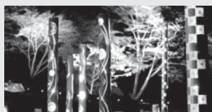
観光資源開発事業 2,400万円