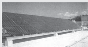
小中学校防災減災低炭素化実現事業 7億6,355万円