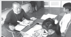
学校における外国人児童生徒サポート事業 288万円