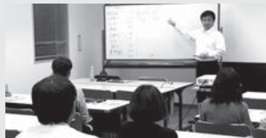
起業・事業所支援事業 4,043万円