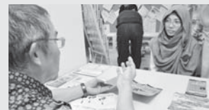
多文化地域共生社会推進事業 411万円