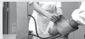
がん対策事業、生活習慣病予防重点プロジェクト事業 1億1,929万円