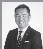
三重県知事 鈴木 英敬