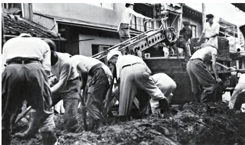
▲伊勢湾台風後、新町の泥を撤去する様子