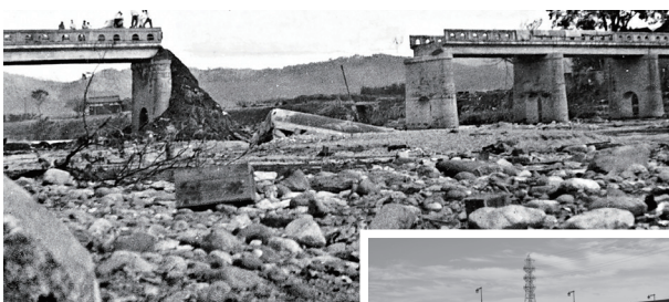
▲伊勢湾台風で流出した新町橋