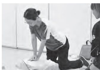
胸骨圧迫(心臓マッサージ)の講習

幸い、今のところ人が倒れて救急車を呼ばなければいけない場面に出会ったことはありません。もし、実際の救命処置が必要な現場に居合わせた場合、学んだことを生かしたいと思います。