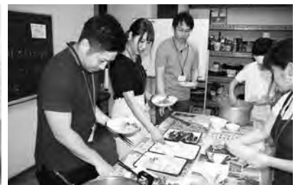
2日目には、5つのグループに分かれ、地域で行われているサロン活動や、ものづくりの体験を通して、住民と交流しました。