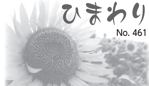
～人権尊重をくらしのなか～ 意見は人権・男女共同参画推進室(☎63-7909)へ