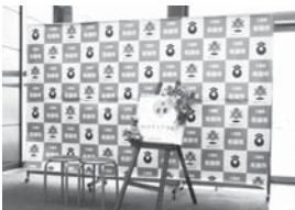
庁舎1階フロアに設置している記念撮影用ボード

現在「体育・健康フェスタ」の内容の見直しを検討中であり、提案いただいた内容と各地域の事業との連携も視野に入れ今後の課題として、朝日公園への遊具の設置は平成30年度に前向きに検討する。