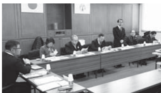
府中市の視察の様子

名張市においても、学力向上・中1ギャップの緩和・学校マネジメントの一貫性のためにも小中一貫教育の早期実現が望まれます。