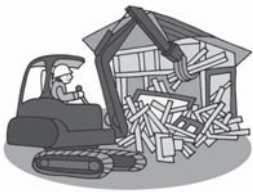
写しを市に提出いただき、適正に処理は完了した。