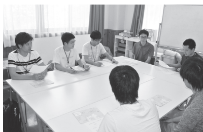
こどもライフサポートセンター「はーと」の 事業内容の説明を聞く