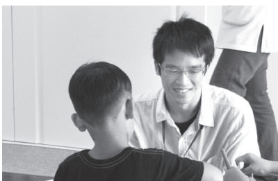
児童発達支援センター「どれみ」での療 育や訓練に参加