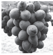
オリエンタルスター

ふるさと納税の寄附額に応じてお渡しする返礼品。市では今、季節限定・数量限定のぶどう「オリエンタルスター」、「シャインマスカット」や「伊賀肉のバーベキューセット」をご用意しています。もちろん、伊賀米、伊賀酒をはじめとする特産品も多数取り揃えています。是非、市内だけでなく、遠方のご家族や友人にもお勧めください。