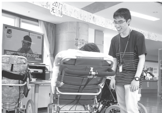
複合福祉施設「第1はなの里」 で入所者との交流