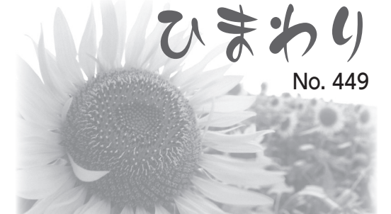
～人権尊重をくらしのなかに～ ご意見は人権・男女共同参画推進室(☎63-7909)へ

ユニバーサル... デザイン(※)... という言葉の意... 味の一つに「分... かりやすさ、明... 確さ」がありま... す。道具の使いやすさや施設の利... 用しやすさは、人が人のことを考... えること、つまり思いやりの心か... ら生まれてきます。どうすれば誰... もが安心・安全に生活できるかを... 考えることこそが、人権を守るこ... とにつながるのではないでしょ... うか。