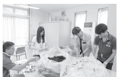
多機能事業所「レインボークラブ」で部 品づくりなどの作業体験