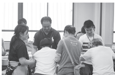
生活介護事業所「ききょうの家」で利用 者とゲームを楽しむ