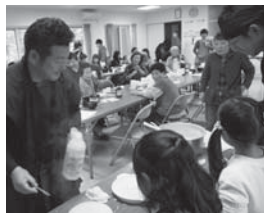
子どもから高齢者まで幅広い世代が参加できるイベントを被災地で開催

6年経つと、私の顔を覚えてくれている人も増え、「あなたの住んでるところでなんかあったら助けにいくからな」と言われたことは本当にうれしかったです。最近被災地復興の意識が風化していると感じることもあります。だからこそ、私は人とのつながりを大切に、被災地の皆さんが望む支援をこれからも続けていきます。市内の皆さんも、東北への旅行や物産品の購入など、名張からの応援をお願いします。