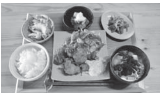
ごはん・メイン・汁もの・小鉢3つの地元食材を使ったランチは2週間ごとに内容を変更