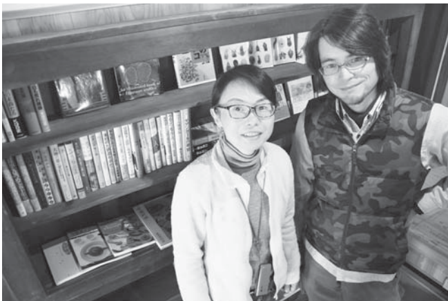
古書店「古書からすり」 ◎1月18日開業予定 住所 中町 363 営業時間 正午～午後 8 時 火・水曜定休日 電話番号 080 - 4308 - 0831