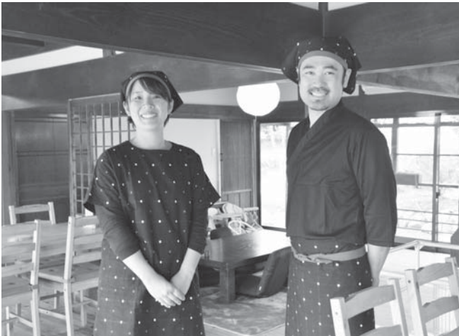
古民家 cafe 「このは」 ◎開業中 住所 井手 344 営業時間 午前 11 時～午後 6 時 (不定休) 電話番号 41 - 2322