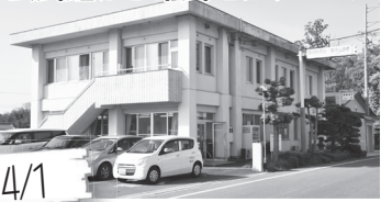
4/1 地域の公民館が、地域づくり活動、生涯学習活動、地域福祉活動の拠点として、「市民センター」に生まれ変わった。