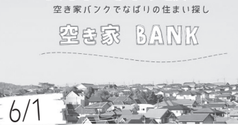
6/1 移住・定住を希望する人に向けて、空き家情報を発信する「空き家バンク」を開始。また、子育て世帯が市外から移住するための中古物件改修費補助を開始