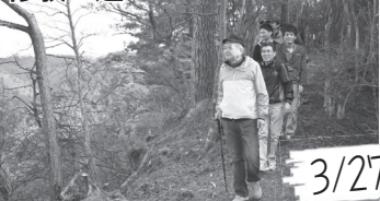
3/27 赤目の長坂山を登るトレッキングコース「修験の道」が開通。新たな観光資源に。