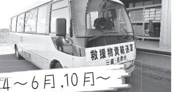
4~6月, 10月~ 熊本地震の被災地を支援するため、本市からも物資支援や職員派遣を実施。多くの市民の皆さんからも、ボランティアや義援金の協力をいただいた。