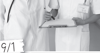
9/1 子ども医療費助成の対象範囲を「小学生6年生」までから「中学3年生」までに拡大