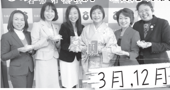
3月, 12月 地域経済の振興や、地域文化の発展を図るために、3月に「ものづくり基本条例」を、12月に「食べてだあこ名張のお菓子でおもてなし条例」を議員提案により制定