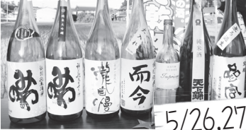
5/26, 27 伊勢志摩サミットで名張の地酒3銘柄や伊賀肉・伊賀牛などが使われた。