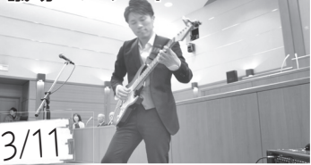
3/11 会議前の議場で、市議会を身近に感じてもらうため、初めての「議場コンサート」を開催