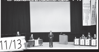
11/13 支援が必要な人に対して、地域、各関係機関、行政が、より連携を取り、ワンストップで解決を図ろうとする「地域福祉教育総合支援システム」がスタート