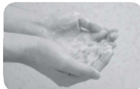
①せっけんを泡立て、手のひらどうしをよくこすり合わせる