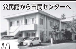
公民館から市民センターへ