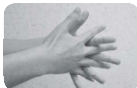
④両指を重ねてこすり合わせ、指の間を洗う