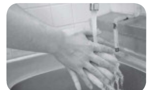
⑥流水で洗い流す。水分は清潔なタオル等で十分ふき取ってください。