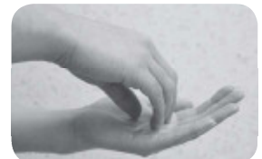
③指先、爪の間も念入りに