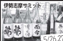
伊勢志摩サミット

熊本地震の被災地を支援するため、本市からも物資支援や職員派遣を実施。多くの市民の皆さんからも、ボランティアや義援金の協力をいただいた。