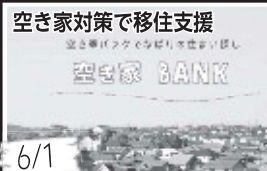
空き家対策で移住支援