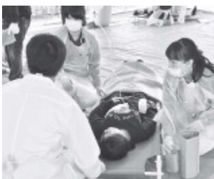
▲重症と判断された患者に迅速な処置