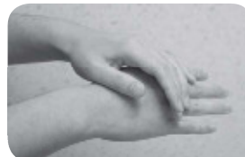
②両手の甲もこすり洗います