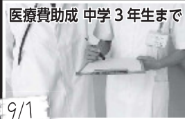
医療費助成 中学3年生まで

移住・定住を希望する人に向けて、空き家情報を発信する「空き家バンク」を開始。また、子育て世帯が市外から移住するための中古物件改修費補助を開始