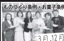
ものづくり条例・お菓子条例

支援が必要な人に対して、地域、各関係機関、行政が、より連携を取り、ワンストップで解決を図ろうとする「地域福祉教育総合支援システム」がスタート