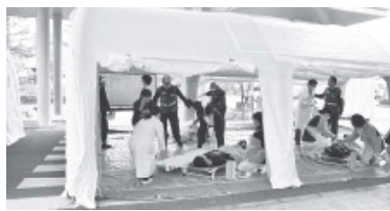
▲病院玄関前に、仮設のテントを設置し負傷者を処置