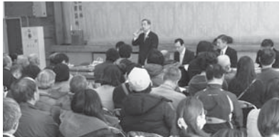
小中学校の規模・配置の適正化後期実施計画についての説明会

関係する保護者や、地域の皆さまへの説明会をこれまで計20回実施した。しかし、反対を含め厳しいご意見など大きな反響があった。ご意見を精査し、今後の進め方を検討する。