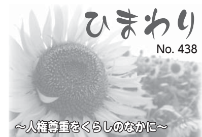
ひまわり No. 438

一度人に飼われたカメは、自然に返されても、エサをとることが大変で生きていけないことも多いため、自然に返すのか飼うのか早く決めなければなりません。