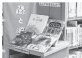
市立図書館に図書を設置

■ 森林所有者などが市内の森林から木材市場へバイオマス燃料として搬出する未利用間伐材への補助