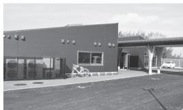
みはた虹の丘保育園

■ みはた虹の丘保育園(旧東部保育園)の移転新築に際し、建材の一部に三重県産の木材を使用