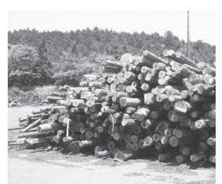
間伐材の一部は粉碎して発電の燃料などに使われます