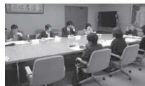
次期基本計画の内容について意見を交わす審議会の様子

仕事と生活の調和(ワーク・ライフ・バランス)や国が進めている女性の活躍推進など新たな取組のほか、平成26年度に実施した市民意識調査結果や今後実施するパブリック・コメントなど、市民のみなさんからのご意見も反映させていく予定です。