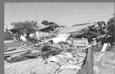
古い家屋を中心に多くの被害が出ました。

一日でも早い復興のため、皆が「被災地のために何か力になりたい」という今の気持ちを風化させずに、自分にできる支援を続けていくことが大切だと感じました。