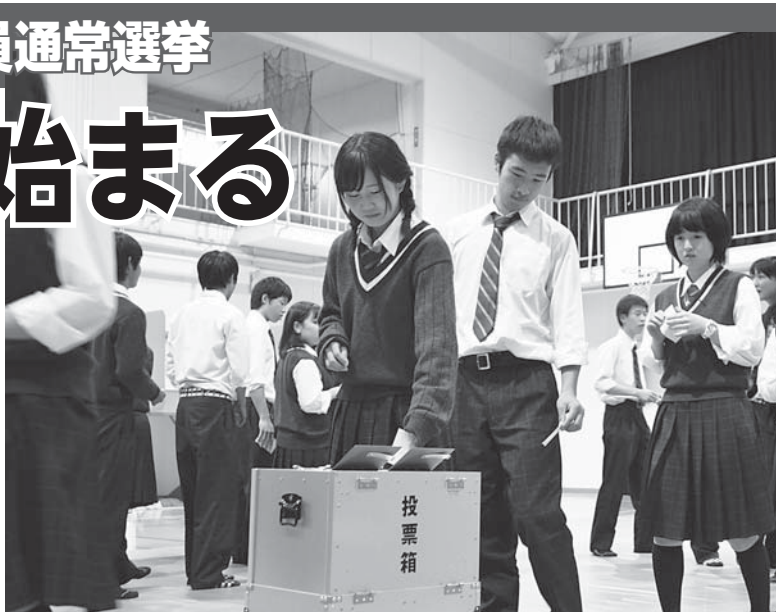
実際の選挙さながらの模擬投票が行われました(名張桔梗丘高校)