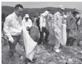
今年は鈴木英敬三重県知事(写真左)もクリーン大作戦に参加

不法投棄は犯罪です(5年以下の懲役又は1,000万円以下の罰金)。不法投棄を見かけたら環境対策室もしくは名張警察署へ通報してください。