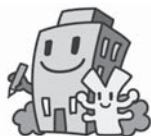
イメージキャラクター ビルクんとケイちゃん