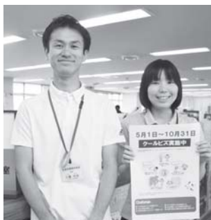
◎適切な室温管理や水分補給をして、無理のない範囲でご協力ください。