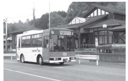
持続可能な公共交通網の構築を目指します