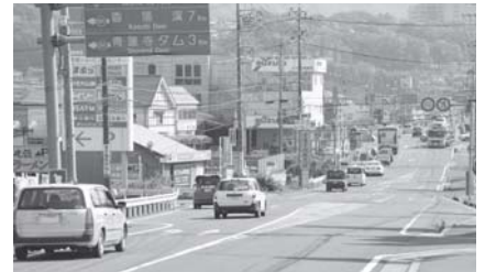
自動車・自転車・徒歩・公共交通といったすべての交通手段が一体的に機能する都市交通体系を目指します