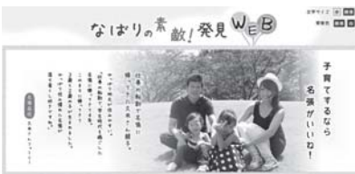
市ホームページ上にある「名張の素敵発見Web」。名張の観光・住まい・子育て情報などを紹介しています。

市のホームページには、移住・定住を支援する「名張の素敵発見web」サイトを開設しています。また、子育て施策などを紹介したリーフレットも作成。市外のイベントや移住相談会にも積極的に参加し、名張の暮らしやすさをPRしていきます。