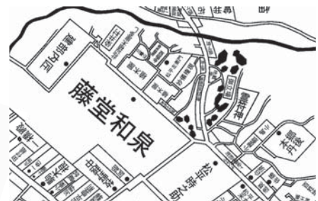
江戸時代の染井村周辺図

そして、少し郊外に出た豊島区本郷駒込に別邸として下屋敷がありました。このあたり一帯は江戸時代、染井村と呼ばれ、下屋敷の前の通りには植木屋