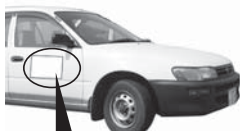
広告を記載したマグネットシート

市の公用車に広告を掲載しませんか。広告を描いたマグネットシートを公用車に貼り付けていただきます。