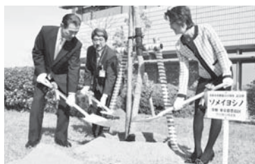
豊島区から贈られたソメイヨシノの植樹

今年のお花見には、少し藤堂藩の武士や藩邸の警護として名張から赴いた無足人の若者たちも見たであろう桜と同じソメイヨシノが今も息づいていることに思いを馳せてみてはいかがでしょう。