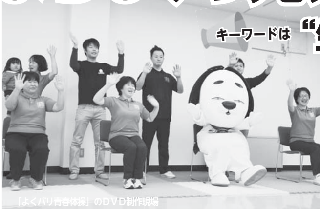
「よくバリ青春体操」のDVD制作現場

名張市は、全国の倍のスピードで高齢化が進んでいきます。そうした中、いつまでも住み慣れたところで元気で暮らすためには、普段から自分の健康づくりや介護予防に心掛けることはもちろんのこと、地域での支え合いも重要になってきます。