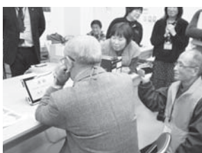
認知症スクリーニング機器を導入

そこで地域ぐるみで認知症サポーター養成講座の受講や、タッチパネル式の認知症スクリーニング機器を導入。認知症の予備軍を早期に発見し、認知症を予防するような取組を始めていきます。