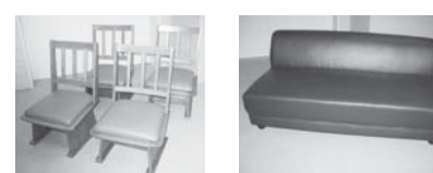
伊賀南部環境衛生組合 ☎53-1120

展示期間 2月5日(木)から25日(木)まで ※月曜日から金曜日午前9時から午後5時、日曜日・祝日は午後1時から5時、土曜日は閉館 展示場所 伊賀南部クリーンセンター(伊賀市奥鹿野) 開札日 2月26日(木) 入札受付 展示期間中に展示場所に備え付けの入札票に必要事項を記入し、入札箱にご投函ください。入札最高価格が複数の場合は抽選