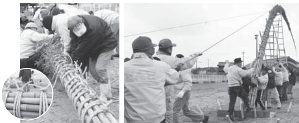
角結びで青竹12本(千支数)と中心竹を束ねます。 長さ約15mの束ねた青竹を、みんなで力を合わせて建てます。