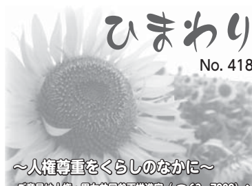
～人権尊重をくらしのなかに～ ご意見は人権・男女共同参画推進室(☎63-7909)へ