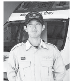
名張消防署警備第二室

救急車の出場件数が増加しています。しかし、救急車を要請した人の約6割は入院の必要のない軽症患者でした。市には4台の救急車がありますが、複数台出場していることも多くあり、全ての救急車が出場している回数も増えていきます。救急車の台数には限りがあるため、要請が重なった場合には、別の消防署所の救急隊が出場することになり、現場への到着が遅れてしまいます。このままでは事故による大けがや心筋梗塞、脳