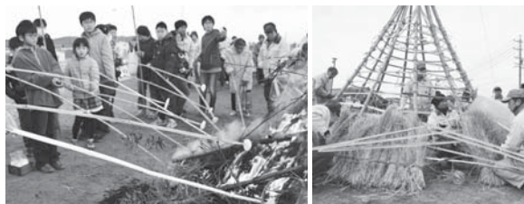
割り竹にお餅を刺して焼く風景 円すい形の小屋にわらを巻きつけます。