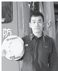
名張市消防本部予防室

現在、住宅用火災警報器は、全ての住宅に設置が義務付けられています。しかしながら、設置されていないご家庭があるのが現状です。住宅用火災警報器は、警報音や音声などで火災の発生を知らせ、「より早く避難する」「より早く初期消火すること」ができるようになります。自身の命はもちろん、大切な家族を守る、住宅防火対策の切り札と言えます。