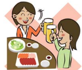
少人数でマスク会食・黙食を