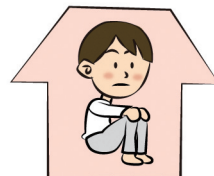
体調が悪いときは 人との接触を回避