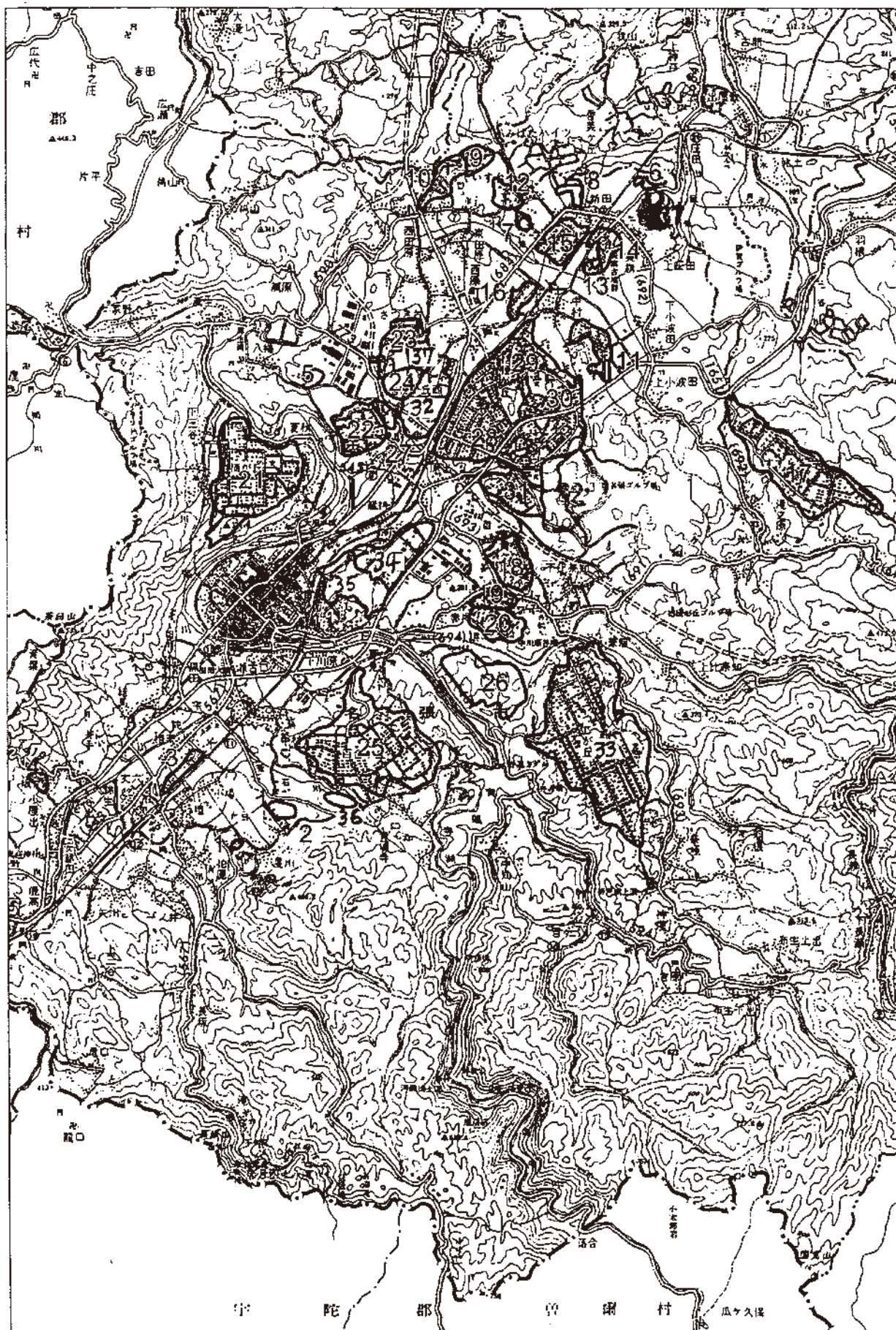
〈図34〉住宅地の開発状況