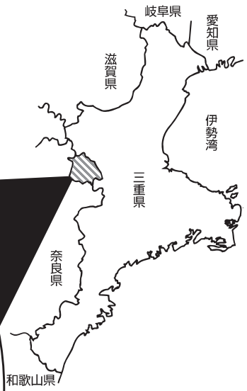
<図1>名張市の概況図