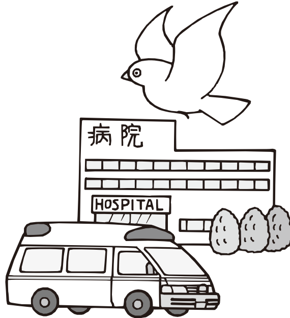
〈図50〉救急事故処理状況（平成22年中）