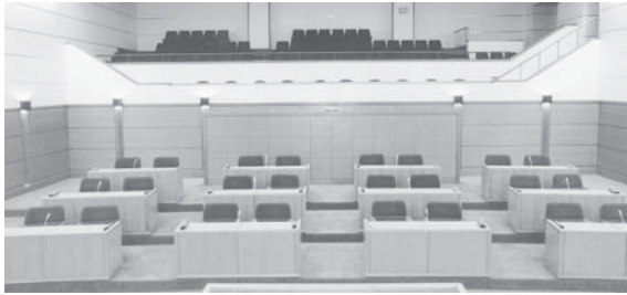
◎ 市議会議員選挙投票所別投票率は2ページをご覧ください。

発行/名張市企画財政部広報対話室 〒518-0492 名張市鴻之台1-1 ☎0595-63-7402 ✉pr@city.nabari.mie.jp 🌐http://www.city.nabari.lg.jp