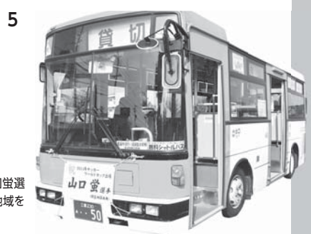
1.山口蛍選手が日本代表に選出された瞬間、市役所ロビーでは大きな歓声が沸いた 2.「ほたるの里」長野県辰野町から山口蛍選手へのメッセージが届いた 3.市役所に懸垂幕を掛け応援ムード一色に 4.旗に寄せ書きをして日本代表へ送った 5.錦生地域を走るほっとバス錦も横断幕で応援 6.市役所窓口にミニのぼりを立てた 7.市議会でも開会前に山口選手にエールを送った