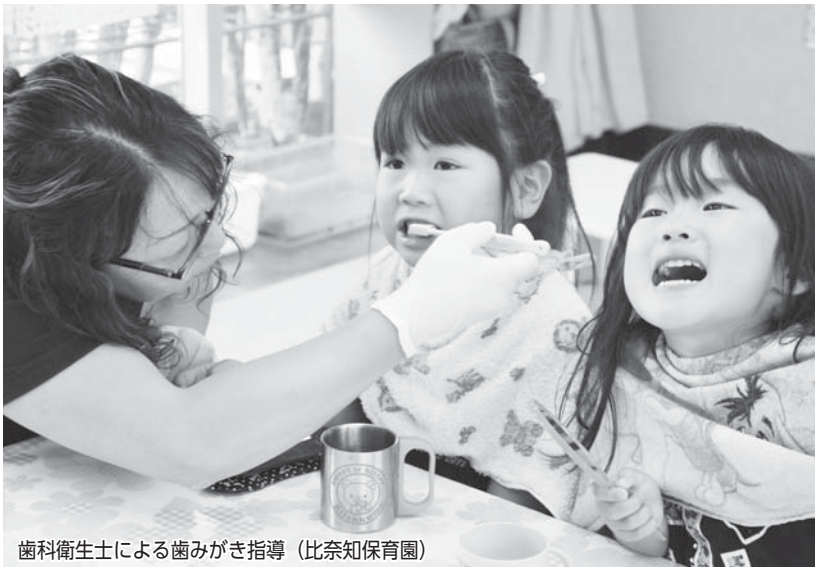
歯科衛生士による歯みがき指導 (比奈知保育園)

発行/名張市企画財政部広報対話室 〒518-0492 名張市鴻之台1-1 ☎0595-63-7402 ✉pr@city.nabari.mie.jp ㊚http://www.city.nabari.lg.jp