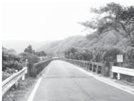
県道上笠間八幡名張線 (薦原橋付近)

伊賀南部浄化センターは、平成12年3月31日に伊賀南部環境衛生組合と薦原地区区長会とで協定書を締結した。操業期間は12年度から26年度までの15年間とし、薦原地区内公共事業推進計画書が市長より提出された。現在、主な残事業は県道上笠間八幡名張線である。早期の完成を望むがいかがか。