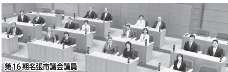
第16期名張市議会議員