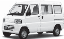
導入予定の電気自動車

石油燃料への依存度を抑え、低炭素社会の実現に向けたスマートシティ構想の推進に向け、電気自動車の購入や市役所駐車場への電気自動車の急速充電設備を整備します。