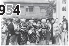
市制施行を祝うパレード