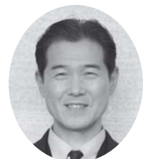
名張市長 亀井 利克

市制施行60周年を迎えるにあたり、名張市議会を代表してごあいさつを申し上げます。 名張市の60年間の道のりは決して平坦なものではなく、財政再建団体への転落や伊勢湾台風による甚大な被害など、幾多の困難を市民が一丸となって乗り越え、着実に都市基盤整備を進め、人口8万人余の都市として発展、成長してまいりました。近年においては、単独自立の道を選んだ名張市にとって非常に厳しい財政状況が続いてまいりましたが、自主自立に