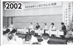
合併の賛否を問うシンポジウム