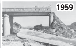
伊勢湾台風で大きな被害