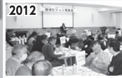
15地域づくり組織が地域ビジョン策定