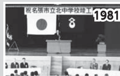
年間人口増加率日本一に 小中学校の開校が相次ぐ