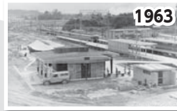
桔梗が丘住宅造成始まる