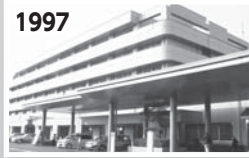
名張市立病院が開院