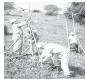
梅の手入れをする環境美化事業部

川西・梅が丘地域には、杉谷神社の参道にある梅の木をはじめ、平成14年に植栽された枝垂れ梅があります。手入れは、数人の有志の皆さんが行っていましたが、作業量、経費負担が大きくなってい