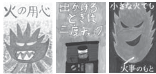
【昨年度の最優秀作品】