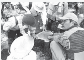
切り株から分かる木の樹齢や森の様子が説明され、来訪者は熱心に聞き入る。

エコツーリズムとは、地域ぐるみで自然環境や歴史文化などの魅力を観光客に伝え、その価値が理解されることにより、保全につなげていくこととする取り組みです。観光振興という側面にとどまらず、地域住民が自分たちの資源の価値を再認識でき、また、自分たちの資源が来訪者からも注目されることで、地域社会の活性化につながっていきます。