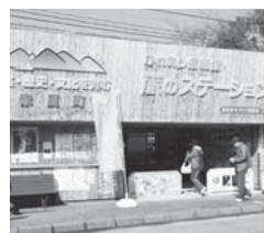
旅のステーションとして情報発信

い環境づくりに取り組んでいきます。今まで個々に活動していた団体・部会も、一つの輪につなげていこうと老人クラブ協議会や小中学校PTAとも連携し、名張クリーン大作戦にも地域をあげて参加するようになりました。目に見えない人と人とのつながりに価値があると感じています。