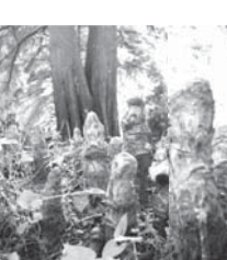
石仏が並んでいるような「ラクウショウ」の気根

名・沼杉」の珍しい気根(呼吸するための特別な根)が地上に伸びています。高さ10cm、30cmぐらいの気根がたくさん集まっております、これほど多く見られる場所はあまりないようです。 今後は、池に架けられていた壊れた橋を復元して、気根のある周遊路を完成させたいと思っています。そして、公園が緑豊かで、季節を感じながら散策できる場になることを願っています。