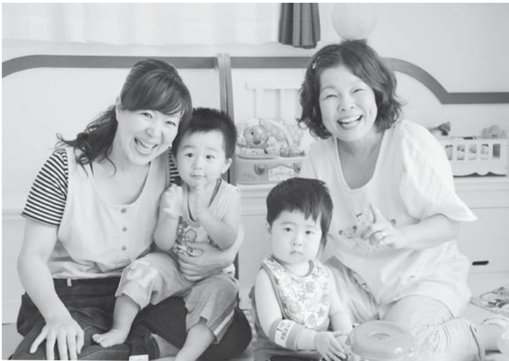
少人数なので子どもに目が行き届き保育ができる 家庭的保育室「Hoppe (ほっぺ)」

市では、待機児童の解消に向けて、3歳未満の乳幼児を保育士の自宅などで保育する「家庭的保育事業」を県内で初めて、8月から実施しています。