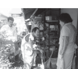
利用者とお話しながら、家の荷物整理

これから新しくサービに加えるのは、一人で買い物に行けない高齢者に対して提供する外出買い物支援サービスへの対応です。少しでも買い物や外出する機会をつくり、高齢者の生きがいにつながるようなサービスを検討していきたいと思