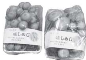
味と香り、歯ざわりがよい 錦生自治協議会の「はたけしめじ」

初年度は、失敗も多くて採算も取れませんでした。今年も、多くの人に声を掛け、協力してもらい、年間を通して安定した生産をしたいと思います。課題もありますが、やってみないと始まりません。