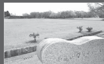
平尾山カルチャーパーク(写真)や朝日公園などの公園・緑地用地を取得