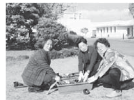
三重刑務所でミニ植樹祭に参加

更生保護女性会は、人間愛をかぎりない情熱を持って、非行や犯罪のないばかりか、誰もが人間らしく尊厳をもって生き生きと暮らせる明るい社会を目指して活動しています。本年も三重刑務所を訪問し、愛の鈴150個、ピオラ・パンジー・ジュリアンの苗各60本を届け、その際、ミニ植樹祭に参加させていただきました。収容者を励ましたり心をなごませたり、立ち直りのために良い環境を整えることに協力させていただきました。