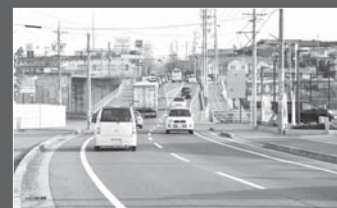
市道名張駅桔梗が丘線(写真)や国道368号などの道路用地を取得