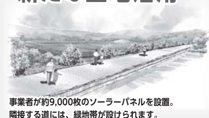
事業者が約9,000枚のソーラーパネルを設置。隣接する道には、緑地帯が設けられます。

住宅開発を目的として土地を購入した不動産業者の倒産により、美旗地域(新田)の約19.5haの山林や田畑が放置されていました。