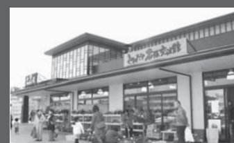
公社経営健全化計画で、公益施設用地を早期に市が買戻し、民間事業者へ貸付