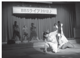
青少年によるライブコンサート

青少年によるライブコンサート BBS会は問題を抱える少年たちと、兄や姉のように接し、少年が自分で問題を解決し成長するための支援をするとともに、犯罪や非行のない地域社会を目指す青年ボランティア団体です。 本年度に、発足40周年を迎えました。名張BBS会は青少年のライブコンサートや、BBSクラブという中高生による活動など全国にも例のない独自の活動を展開し、青少年の健全育成に寄与しています。