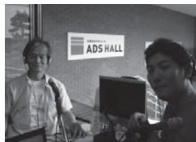
FM なばりに出演し、運動をPR