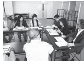
伊賀少年サポートセンターとの協議