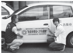
市の公用車にステッカーを貼り啓発