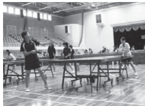
伊藤和子杯中学生卓球大会