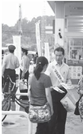
大型店舗で市長や警察などと啓発