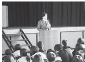
中学校での犯罪予防教室