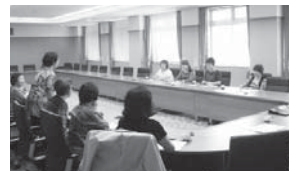
名張商工会議所女性会と女性保護司との懇談

犯罪や非行をした人を排除するだけでは、安心・安全な社会を実現することはできません。これらの人たちが社会に帰ってきた時、その更生の決意を支え、立ち直れるよう援助し健全な社会の一員とすることが必要です。 特に就職し、責任ある社会生活を営むことは、立ち直りに向けた大きな一歩になります。更生保護のための就職に協力いただける雇用主には、試用雇用(試用雇用奨励金あり)、身元保証システム(1年間保証。損害賠償見舞制度あり)、職場適応・定着指導員による事後支援などがあります。詳しくは保護司会事務局までお問い合わせください。