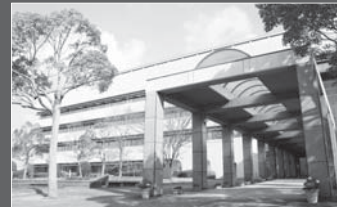
市役所庁舎(写真)や市立病院、総合福祉センターなどの公共施設用地を取得