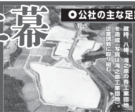
蔵持、八幡、滝之原の各工業団地を造成(写真は滝之原工業団地)。企業誘致に取り組み

平成24年9月、市が公社の借入金12億3700万円を代位弁済(※)。これに伴い、公社からは比奈知ダム土捨場などの保有土地の引き渡しを受けましたが、それでも約9600万円が不足しました。そこで、市は市議会の承認を得てその権利を放棄。これにより、公社の債務が解消されることになり、昨年10月に県知事から公社解散の認可を受けることができました。その後、残余財産の処分を目的とした清算手続きを行い、今年2月に清算が完了しました。市では、今後も公社から引き継いだ土地をはじめとする市有地の有効活用や早期の売却を進めていきます。