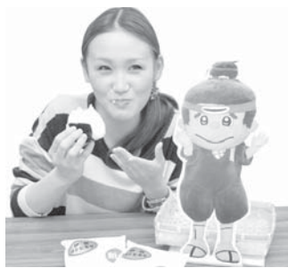
名張市公式 Facebook ページ http://www.facebook.com/city.nabari