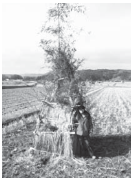
村入り後初の行事「どんど焼き」