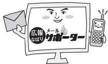
イメージキャラクター「メルサポ大使」

登録者には、電子メールを活用し、「広報なばり」に関するアンケートを配信します。アンケートは、記事が分かりやすかったか、分かりにくかったかなど簡単なものを中心で。