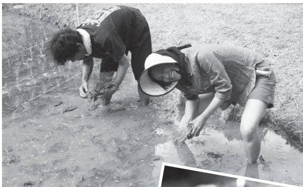
米作りに挑戦。収穫の喜びは格別!!