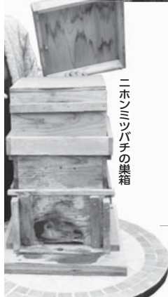
ニホンミツバチの巣箱