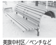
美旗中村区/ベンチなど