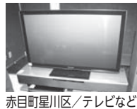
赤目町星川区/テレビなど