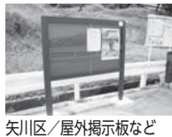
矢川区/屋外掲示板など

財団法人自治総合センターの一般コミュニティ助成事業と地域防災組織育成事業を活用して、10の自治会などが備品を購入しました。