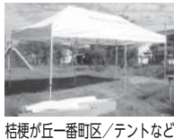
桔梗が丘一丁目区/テントなど