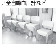
箕曲中村区/会議椅子など