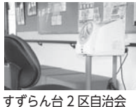
すずらん台2区自治会/全自動血圧計など