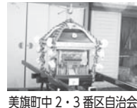
美旗町中2・3番区自治会/子ども用お神輿など