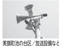
美旗町池の台区/放送設備など