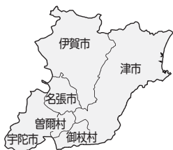
東大和西三重観光連盟

名張市・伊賀市・宇陀市・宇陀郡が合併して25万人の中核都市を目指してはどうか。総選挙が終わると、「地域主権型道州制」の動きが加速する。病院の経営統合や消防広域化問題の解決、東大和西三重観光連盟の強化、淀川水源都市の魅力もある。合併の是非を問う住民投票から平成25年2月で10年が経つが、見解を求む。