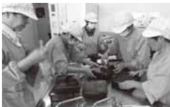
配食サービスを担うボランティア

地域の配食サービスは、高齢などの理由により調理が困難な人を定期的に訪問し、調和のとれた食事を提供する。同時に安否確認・健康状態の確認を行う事業。平成23年度は649人に年間2万食余りを提供していた。行政の配食サービスと同様、一人暮らし高齢者を身守り、安心安全な地域生活を支えている。名張市社会福祉協議会と連携を図り支援に努める。