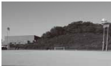
名張市陸上競技場

新たな施設の整備は難しいが、サッカー人口は増加しており、サッカー施設の整備は必要だ。陸上競技場の再整備を含め、全体的な整備計画を作る必要がある。