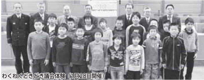
わくわくどきどき議会体験 (11月23日開催)

● 議会広報特別委員会 ● 三重県名張市鴻之台 1-1 ● 電話 63-7834~5 FAX 64-8870 ● gikai@city.nabari.mie.jp