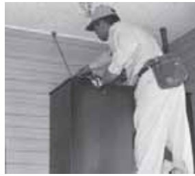
転倒防止用家具固定金具

A 地震への備えとして自宅の家具などの転倒防止策は特に重要と考えている。家庭でできる減災対策として、出前トクや地域づくり組織・自治会などの自主防災組織で実施される防災訓練などが有効である。防災センターの体験コーナーや広報紙などにおいて、市民への啓発を行ってきたい。