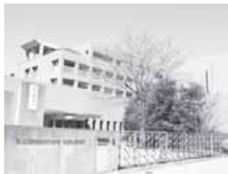
新センターが入る元製薬会社研修所

A 両センターは同じ建物に作り、国の補助事業を受ける計画だ。当初は別に開設する予定で、23年度150万円の設計料と年間312万円の家賃を計上した。家賃は3年契約をしており、新たな場所でのオープンの間、相談業務などを行う。