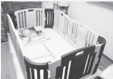
▲ベビーサークルなどで、犬の安全を確保している

た。しかし、このままでは、ご近所に迷惑がかかる、そして世話をする自分たちが倒れると思い、使用には抵抗がありましたが、鎮静剤などを服用させるようにしました。おかげで夜は少し落ち着きました。