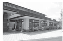
▲とれたて名張交流館

日時 10月3日・17日・31日、 11月7日・14日すべて水曜日 午前9時～午後3時予定