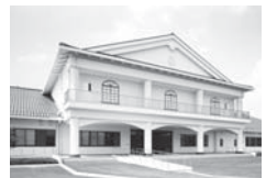
▲武道交流館いきいき

対象 市内在住で中学生以上の人 定員 各日20人 ※最少催行人数10人 申込 9月13日(火) 午前8時30分から電話(63-7402)で受付開始 ※先着順。受付は、各実施日10日前まで 昼食場所(会議室)を準備します。