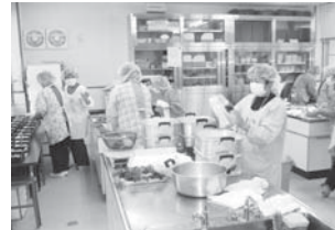
地域の協力ボランティアさんは50人!

薦原の地域ビジョンを作成する際に行った住民アンケートで、配食サービスの実施を望む声があり、地域づくり委員会として取り組んでいくことになりました。そこ