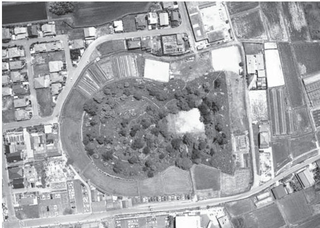
美旗地域には、県下最大級の前方後円墳である馬塚古墳(写真)をはじめとする7つの古墳からなる美旗古墳群や多くの文化遺産が残ります。

発行/名張市企画財政部広報対話室 〒518-0492 名張市鴻之台1-1 ☎0595-63-7402 ✉pr@city.nabari.mie.jp 🌐http://www.city.nabari.lg.jp