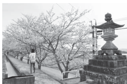
各季節さまざまな表情を見せる新田水路(写真は春)