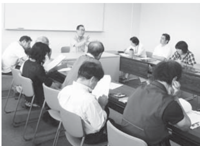
「語り部養成講座」で熱心に話を聞く受講者

新田水路が生活している地域です。地域内には、5世紀後半に構築された県下最大級の馬塚古墳をはじめとする多くの文化遺産が残り、美しい自然を感じられる地域です。 まちづくり委員会では、美旗地域の10年、20年先の将来像を示す地域ビジョン「みはた・ミュージアム・マスタープラン」の中で、古墳群を含む自然環境の有効活用を掲げています。昨年は、古墳のことをより多くの人に知っていただくことと、子どもたちにも理解できる案内板を7つの古墳に設置しました。 また、史跡整備事業だけでなく、今年度は、美旗市民センターと共催で、美旗を訪れる皆さんに美旗の魅力を発信する「美旗の語り部」を養成する講座を開催しています。自分