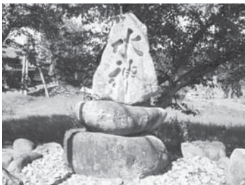
赤目町丈六の水神碑

次らは身の危険を顧みず浸水の防御にあたることに、暗闇と雨の中を逃げまどう村人たちを安全な高台へと誘導した。家屋、田畑の損害は甚だしく、収穫期を前にした村民の苦しみは言語に絶した。先の両名はこれを憂い、引水後、村人を徴して復旧に狂奔、朝は星をいっただいて現場に向かい、夕は月影を踏んで帰路につくなど、率