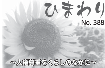
～人権尊重をくらしのなか～ ご意見は人権・男女共同参画推進室(☎63・7909)へ

入学直後に弟が産まれ、兄である長男とゆったり向き合う機会が少なくなりました。時期でもありません。長男へかける言葉は、「早く」や「きちんと」が中心に