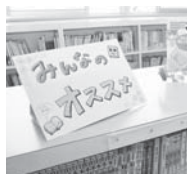
明るい雰囲気のある学校図書館

支援員さんやボランティアさんが来てくれる日を子どもたちは、楽しみにしています。古い本の整理や読み聞かせの活動など、学校図書館は、さまざまな皆さんにかかわっていただき、支えられています。