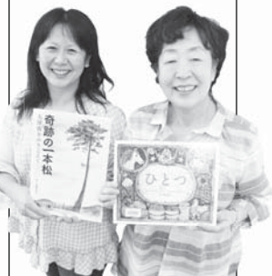
学校図書館ボランティア

市内の小中学校4校で支援員として、本の整理などを行っています。蔵持小学校にも週に1度来ています。先生や地域のボランティアさんと協力しながら、子どもたちに読書の大切さを伝えるお手伝いをしています。