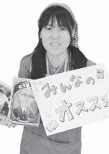
学校図書館運営支援員