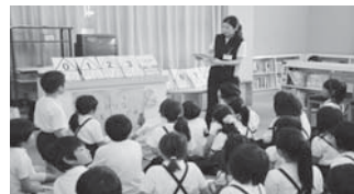
「本は大事にしよう」市立図書館からお話の日