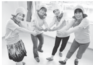
チャーミングな桃の帽子で体操を広める