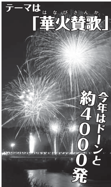
名張川納涼花火大会実行委員会事務局 社名張市観光協会 ☎63-9148

場所 名張川新町河畔および黒田地区内 日時 7月28日(土) 午後7時50分(少雨決行)