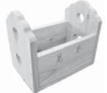
木工体験もできます!

<午前> はぐくみ工房あららぎで木工体験 <午後> 市庁舎見学→アドバンスコープ スタジオ見学 日時 8月16日(木) 午前9時~午後3時(予定) 対象 市内在住の小学生 ※小学3年生以下は保護者同伴 定員 20人 ※先着順、最少催行人数10人 申込 7月11日(木)から25日(木)までに電話で問い合わせ先へ 参加費 1,000円(木工体験材料費) ◎お弁当・水筒をご持参ください。